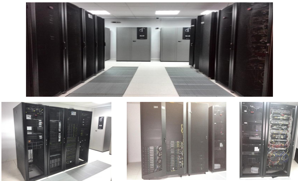
Fig. 1. Centrul GRID RO-14-ITIM; sus: vedere generala; jos: infrastructura ATLAS-GRID, infrastructura HPC și nodul central al rețelei de date.

Centrul GRID al INCDTIM beneficiază de 2 rânduri acâte 5 rack-uri de 42U fiecare cu diferite echipamente de procesare și stocare de date, precum și comunicație. Capacitatea lui în cazul instalării exclusive a Blade-urilor este de 3584 core/6 rack-uri, sau 448 de procesoare, sau 224 de calculatoare quad procesor, restul de 2 rack-uri folosindu-se pentru rețeaua internă INCDTIM și sistemul de backup în caz de cădere a tensiunii electrice de alimentare (Figura 1.).