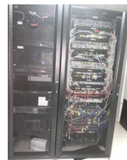
Fig. 1. Centrul GRID RO-14-ITIM; sus: vedere generală; jos: infrastructura ATLAS-GRID, infrastructura HPC și nodul central al rețelei de date.